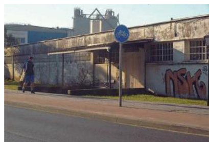
Parcela en la que está previsto ubicar el centro de día para enfermos de alzhéimer.